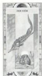
9. Der Stör Schlüsselbegriff: Gelehrtheit

Symbolik der Karte: Es wird erzählt, daß der Stör bereits zur Zeit der Dinosaurier existiert habe. Seine außergewöhnliche Widerstandskraft und seine Fähigkeit, gegen den Strom zu schwimmen, um seine Eier abzulegen, ließen ihn zum Symbol der Freiheit, der Individualität und der Gelehrtheit werden, die man erwirbt, indem man alle